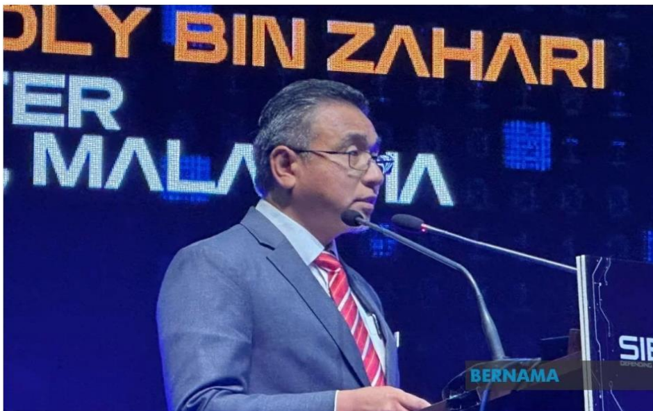
Timbalan Menteri Pertahanan Adly Zahari hadir merasmikan Siber Siaga 2023 di Pusat Konvensyen Kuala Lumpur (KLCC).

KUALA LUMPUR: Kementerian Pertahanan akan bekerjasama dengan agensi pusat untuk merangka struktur baharu Bahagian Siber dan Elektromagnetik Pertahanan (BSEP) Angkatan Tentera Malaysia (ATM).