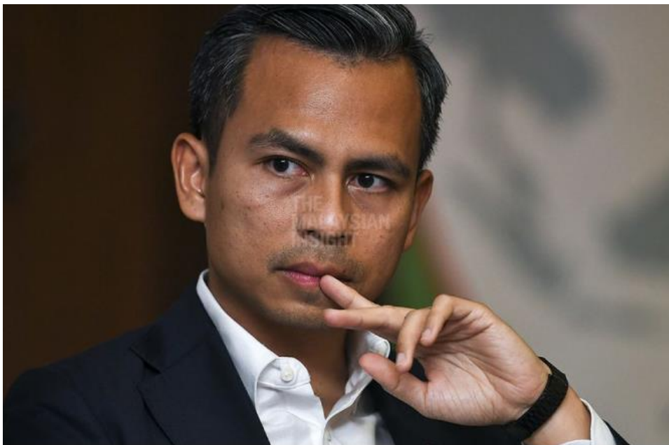
Menteri Komunikasi dan Digital Fahmi Fadzil berkata pindaan Akta Perlindungan Data Peribadi (Akta 709) dijangka dibentangkan pada di Parlimen seawal Oktober ini. – Gambar fail The Malaysian Insight, 15 Ogos, 2023.

KEMENTERIAN Komunikasi dan Digital (KKD) sedang menilai keperluan mewujudkan jawatan pegawai perlindungan data dalam organisasi, melalui pindaan Akta Perlindungan Data Peribadi (Akta 709), bagi melindungi data peribadi individu.